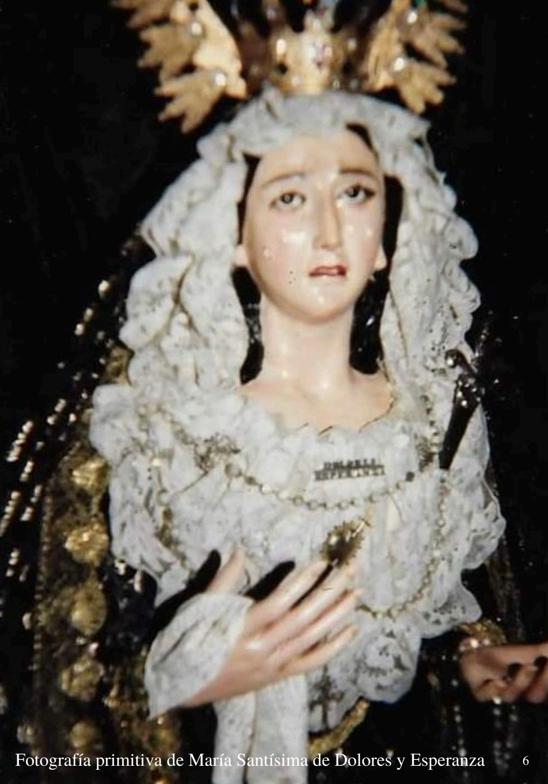
Fotografía primitiva de María Santísima de Dolores y Esperanza